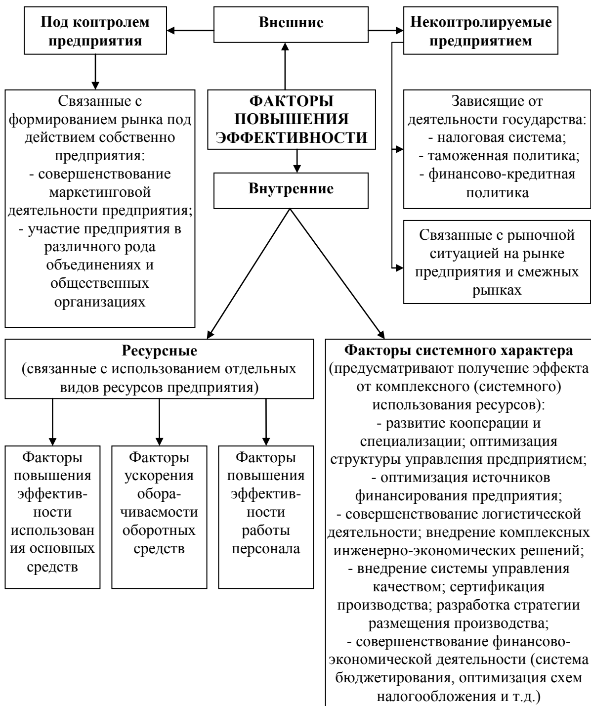
Рисунок 1.2 – Классификация факторов повышения эффективности деятельности предприятия

Если строки или графы таблицы выходят за формат страницы, таблицу делят на части, располагая одну часть под другой, или рядом, или переносят часть таблицы на следующую страницу. Слова «Таблица ___» указывают один раз слева над первой частью таблицы, над другими частями справа