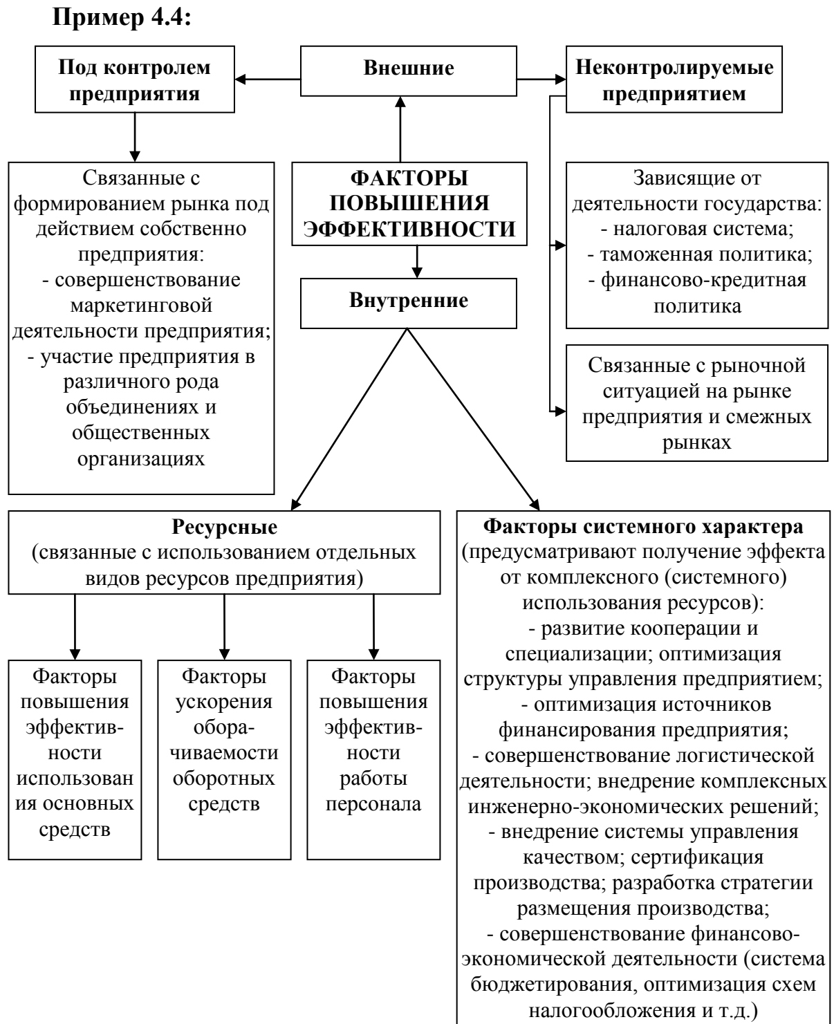
Рисунок 1.2 – Классификация факторов повышения эффективности деятельности предприятия

Если строки или графы таблицы выходят за формат страницы, таблицу делят на части, располагая одну часть под другой, или рядом, или переносят часть таблицы на следующую страницу. Слова «Таблица ___» указывают один раз слева над первой частью таблицы, над другими частями справа